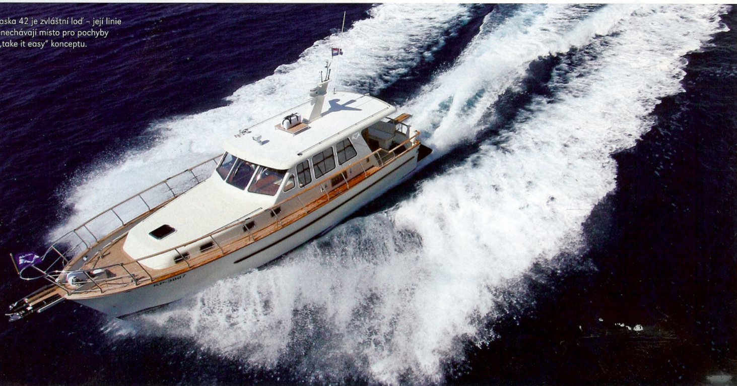
Alaska 42 je zvláštní loď – její linie nenechávají místo pro pochyby o „take it easy“ konceptu.

Následující níže položená část interiéru se skládá ze dvou kajut a koupelny. Příďová kajuta je vybavena manželským lůžkem a velkým počtem přihrádek. Kromě pěkného vnitřku a množství dřeva tato kajuta nejvíce fascinuje velikostí šatní skříně. Šatna na lodi nebývá pravidlem, a tato je vskutku přepychově dimenzovaná. Pokud tedy vyplouváte s Alaskou, nebudete muset vybírat mezi oblečením, jež byste si chtěli vzít s sebou a jež budete